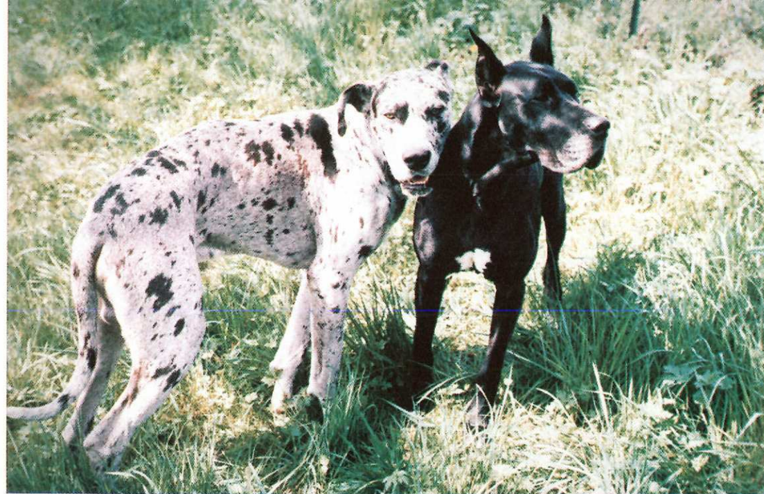
Photos de Tania, Cesar et Dolly envoyées par leurs maîtres satisfaits.

Dans les abandons de cette année, celui qui nous a le plus marqué est l'arrivée d'une petite chienne Beauceron d'un mois et demi environ, amputée de la patte avant gauche par un "vétérinaire". Elle avait été trouvée dans un lotissement. Après quelques jours passés à la maison, nous avons dû l'emmener chez notre vétérinaire, avec le cœur gros. Mais impossible de faire autrement.