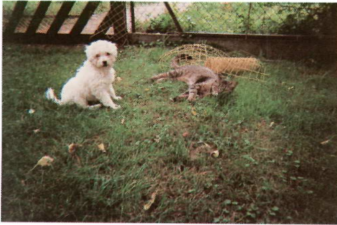
"Luciole" a été abandonnée avec sa mère. Elle s'entend très bien avec le chat de la maison et a beaucoup d'espace pour gambader.