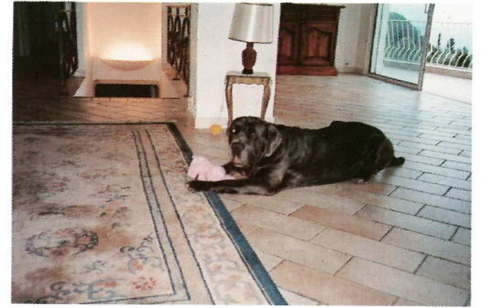
"Gamin", notre second mâtin de Naples, a quitté le refuge pour Cannes. Très choyé. Ses maîtres nous ont écrit : "Quelle chance nous avons de l'avoir. Merci !"