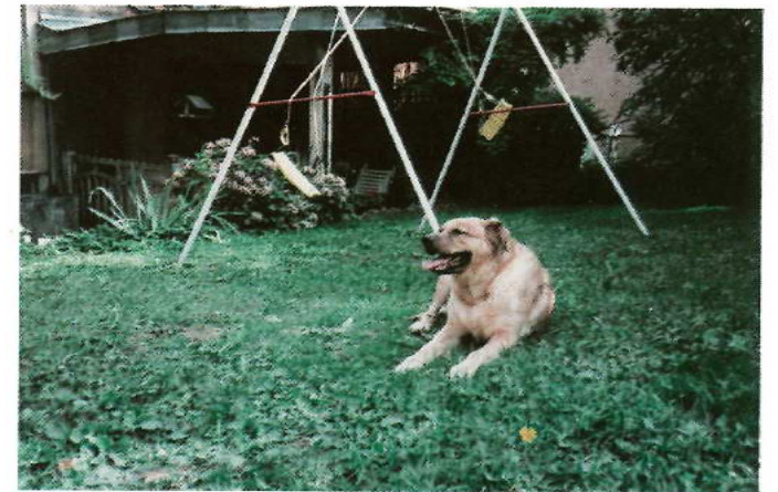
"Rox" souffre du cœur ; Depuis son adoption, ses maîtres ne partent donc plus en vacances. Le voyage le fatiguait trop.