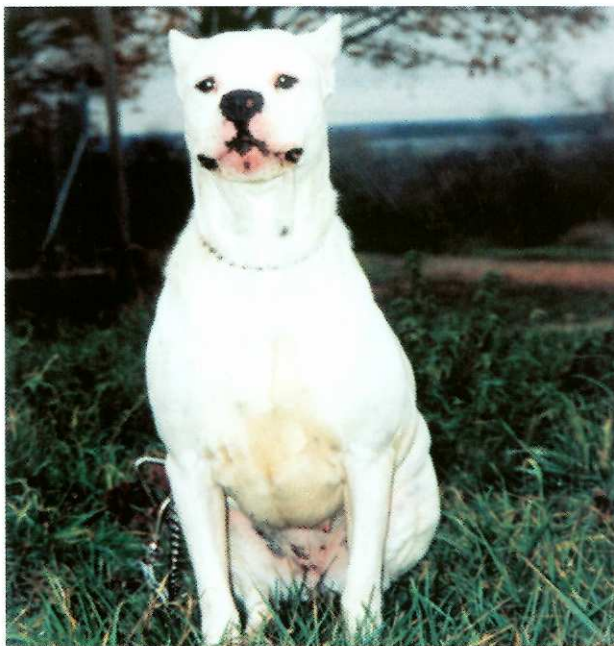
“ RIZA ”, gentille femelle dogue argentin

Merci encore une fois aux gentilles bénévoles qui, grâce à une nouvelle “opération caddies” au Centre Leclerc de Toul, ont pu recueillir près d’une tonne d’aliments pour nos chiens et nos chats.