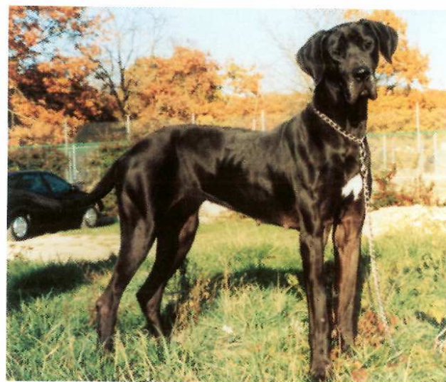
" TEIZA ", jeune femelle dogue allemand, ne demande qu'à être adoptée.

D'avance, je vous dis de tout cœur Merci pour l'aide que vous nous apporterez.