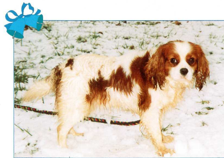
... et un Cavalier King Charles mâle de deux ans arrivé au refuge récemment.