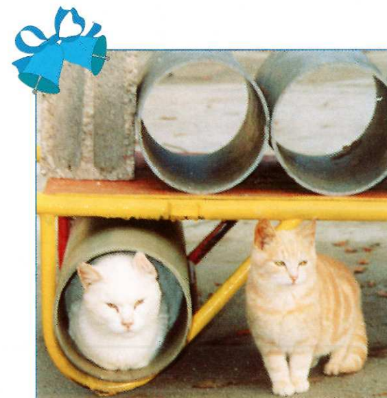
Deux pensionnaires de notre chatterie...