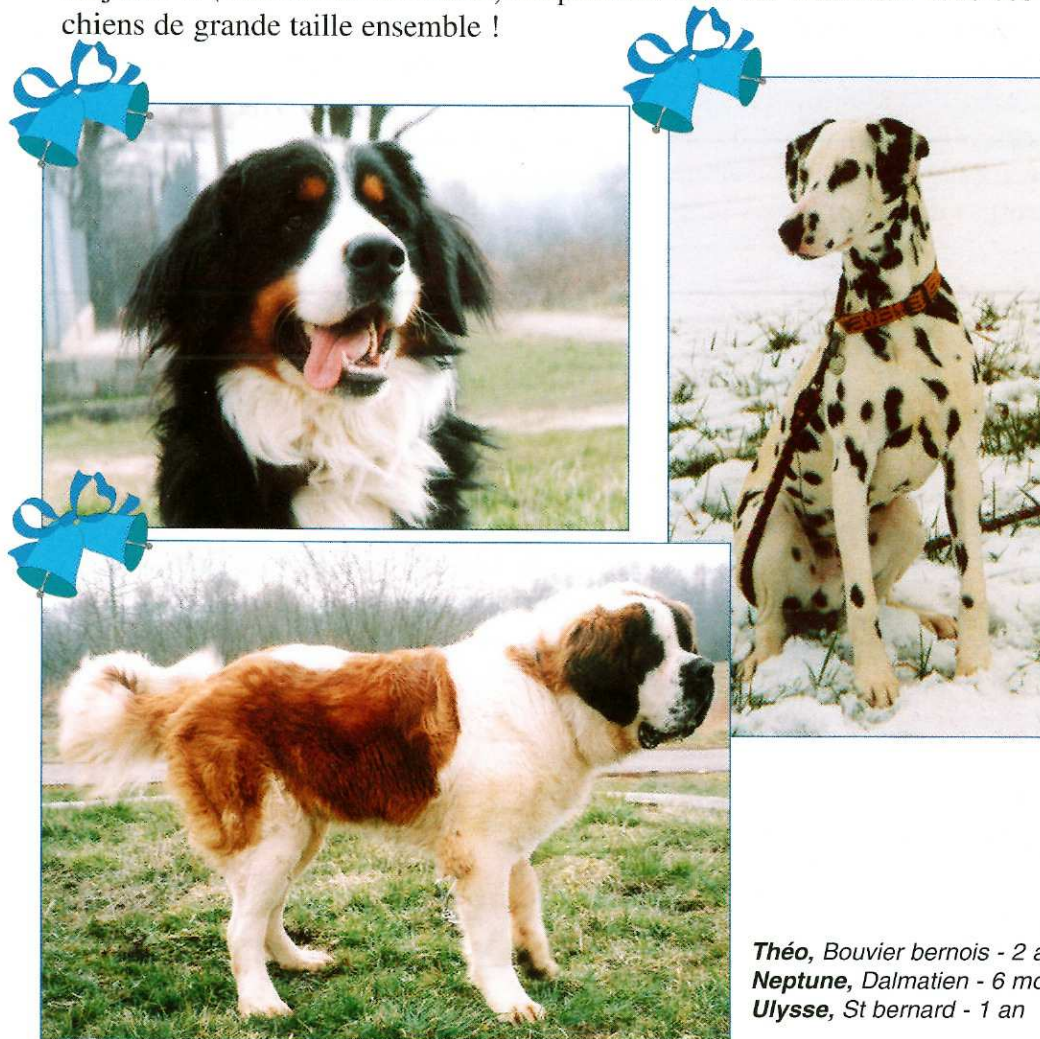
Théo , Bouvier bernois - 2 ans Neptune , Dalmatien - 6 mois Ulysse , St bernard - 1 an

Dans notre bulletin du mois de décembre, j'évoquais l'achat des boxes qui nous sont indispensables. En effet, les abandons ne cessent pas et les chiens de grande taille sont particulièrement difficiles à installer. Parmi ceux-là, nous avons accueilli ces deux derniers mois : un mâle Terre-neuve de quatre ans, un nouveau mâle Saint-bernard d'un an, un Bouvier bernois de deux ans... Egalement un croisé berger allemand, un Rottweiler et un Cavalier King Charles. Tous ces chiens sont des mâles âgés de deux ans, plus un couple de Huskies âgés de dix ans. Tous les chiens sont vermifugés à leur entrée et traités contre les puces, ceci afin d'éviter que les autres animaux du refuge ne soient infestés. Les deux Schnauzers et le Dogue argentin sont toujours là ( bulletin de décembre ). Impossible bien sûr d'installer tous ces chiens de grande taille ensemble !