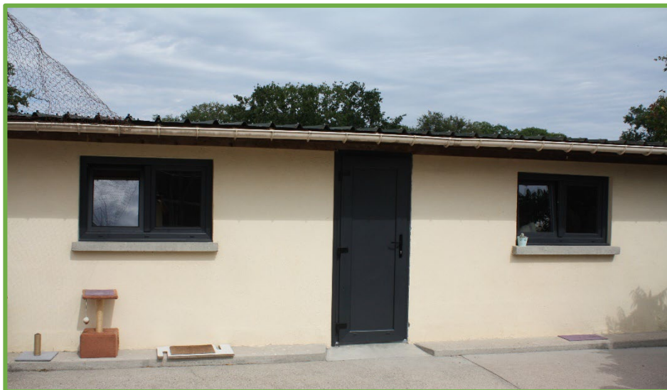
La chatterie avant et après