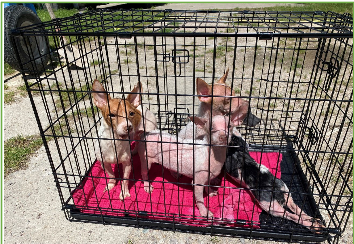
Photo prise lors de leur arrivée au refuge dans cette cage...

Nous venons de traverser un été mouvementé, malheureusement nos compagnons ont encore été trop souvent victimes de la bêtise humaine ! Nous avons recueilli quatre croisés de chihuahua dans un état lamentable... La peau sur les os, sans poils, l'un d'eux ne tenait plus sur son train arrière et se traînait au sol... Il a fallu le remuscler, lui « apprendre » de nouveau à marcher en faisant de la piscine et des petites marches... L'une d'entre elles n'a pas de mâchoire inférieure mais elle parvient tout de même à se nourrir et heureusement mener une vie des plus normale. Attendre un tel extrême de problèmes de santé pour confier ses chiens est une honte !