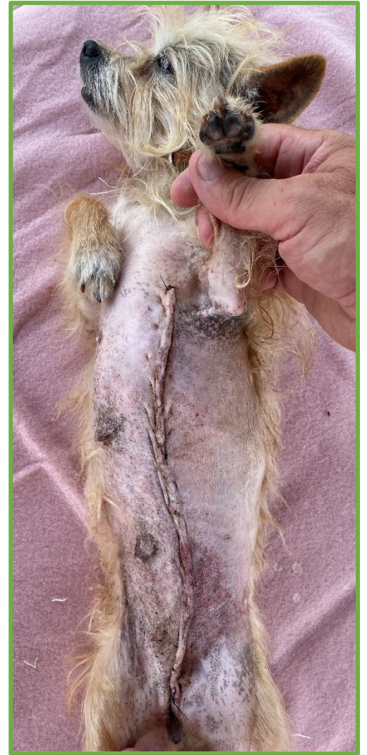
Jina le jour du retrait de son pansement et son impressionnante cicatrice.

Je suis heureux de vous annoncer une belle adoption : Hera femelle malinoise âgée de huit ans a enfin trouvé un foyer cet été après un peu plus d'un an de refuge ! Handicapée des deux pattes avant, il est impossible pour elle de courir, sauter ou de faire de longues balades mais n'en reste pas moins adorable pour autant. Elle trouvera un nouvel équilibre auprès de sa maîtresse et de son acolyte.