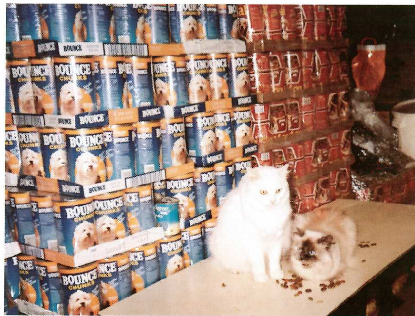
Persan et angora, un couple très doux.

Nos boxes sont bien tristes. Nous voulions les refaire cette année, mais... grillage, agglomérés, ciment... Tout cela fait beaucoup de dépenses. Nous aurions bien besoin de dons en matériaux.