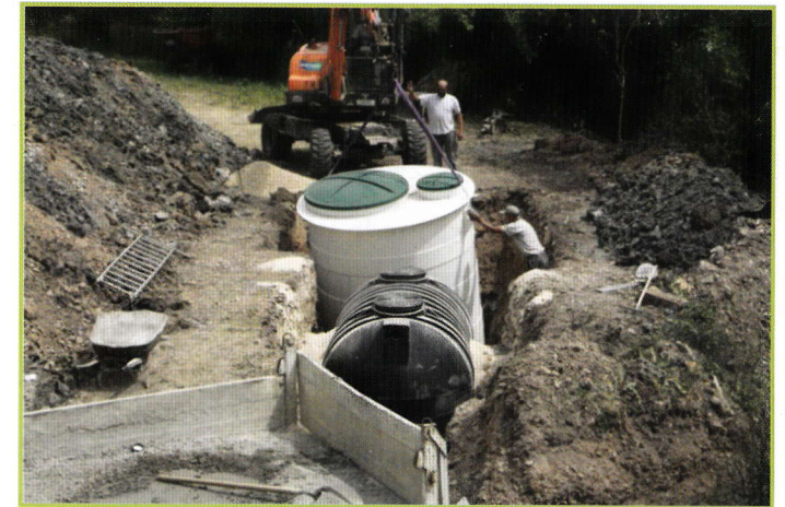
Photo prise lors de la pose des cuves.

De bonnes nouvelles cette fois-ci pour la station d'épuration qui est enfin mise en place et fonctionnelle après plus de trois ans d'attente ! Gros soulagement donc, le dernier contrôle de la S.D.A.A validé, c'est plus de 22 500€ dépensé sur 3 ans pour cette mise aux normes. Une énorme somme mais aussi un poids en moins après avoir rencontré toutes les peines du monde à cette bonne installation !