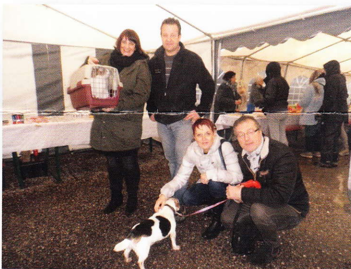
Caramel & Viking avec leurs heureux nouveaux maîtres et moi-même.

De bonnes nouvelles sont à recenser tout de même avec les adoptions de Caramel, chat de 5 ans arrivé au refuge suite au décès de ses maîtres, tout comme Viking jack russel de 13ans, tous deux auront droit à un doux foyer et une vie paisible dès à présent.