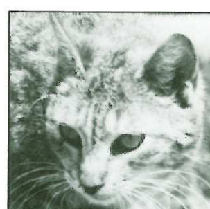
GRISOU - 6 ans