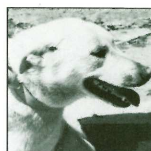
RITA - 8 ans