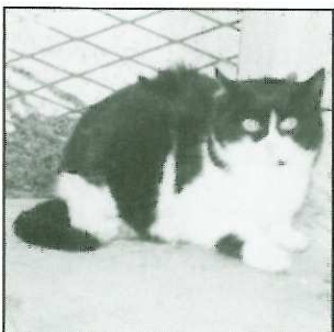
PIERROT - 6 ans