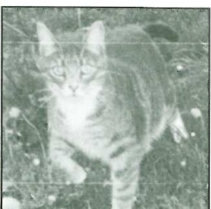
FIFILLE - 4 ans