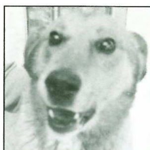
TOBY - 8 ans