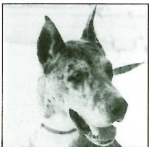
VENUS - 7 ans

YOLI : Croisé griffon et ratier. Robe blanc cassé. Son Maître est décédé.