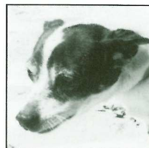
BICHE - 10 ans