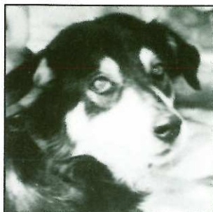
TANIA - 7 ans