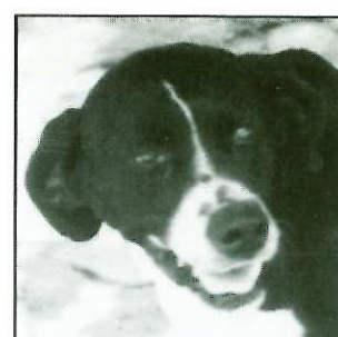
BOBETTE 6 ans environ