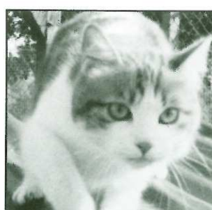
ROUSKY - 7 ans