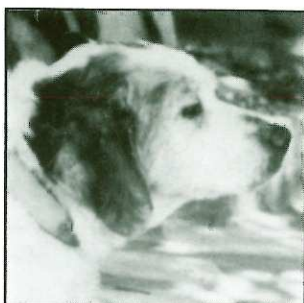
PATY - 14 ans