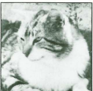
PEPERE - 10 ans