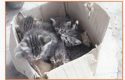
pour finalement arriver 7 !

Nos autres pensionnaires félines se portent bien et attendent une famille d'adoption qui tarde à arriver pour certains