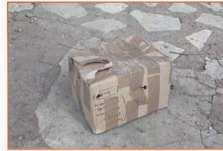
Le fameux carton...

Du côté de nos amis les chats, c'est la même chose. De nombreux abandons sont à déplorer et de façon pas plus sympathique : sept chatons d'âges différents (certains n'étant pas encore sevrés) ont été déposés dans un tout petit carton devant le refuge dans lequel ils ne pouvaient à peine bouger !