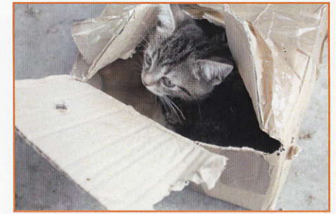
une petite tête...