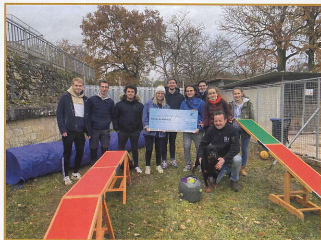
Le groupe d'élèves ayant mené le projet

Un cadeau pour nos protégés est arrivé de la part des étudiants de l'école des mines de Nancy. Cette année ils ont monté, un projet visant à créer un parc de loisir et d'agility. Mission accomplie pour eux et pour le plus grand bonheur de nos amis canins qui maintenant, peuvent profiter d'un tunnel, une rampe et une balançoire pour travailler l'agilité ainsi qu'un lanceur de balles pour les plus joueurs d'entre eux.