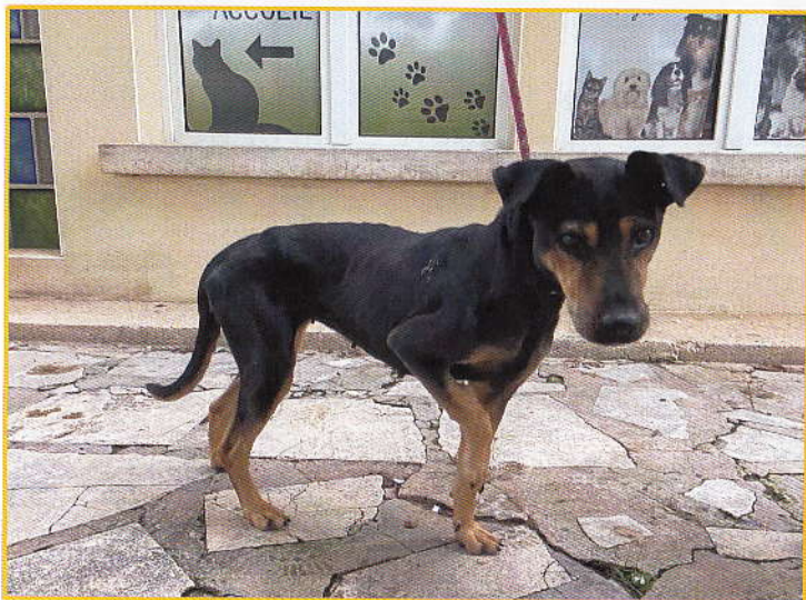
Bonnie quelques jours avant l'opération.

Nous avons accueilli récemment Bonnie, jeune chienne croisée-berger de deux ans. Cette pauvre petite a dû subir une importante opération suite à une fracture radius-ulna, comme vous pouvez le voir sur la photo ci-dessous. Elle est aujourd'hui en phase de rééducation, tout en évitant les gros efforts. Le coût de l'opération s'élève à 915€ mais une nouvelle vie débute pour Bonnie et dès qu'elle aura retrouvé toute sa mobilité, nous espérons lui trouver une nouvelle famille pour s'épanouir.