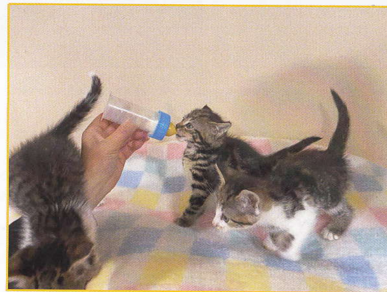
Trois des chatons encore nourris au biberon.

La période est encore aux chatons... certains nous arrivent déjà sevré et en bonne santé. Pour d'autres il faut s'armer de patience et les nourrir plusieurs fois par jours au biberon avant qu'ils puissent être autonomes et en âge d'être adoptés. Par chance, les adoptions de nos amis félines ont redémarré depuis mi-août et cela nous permet de ne pas avoir une chatterie surpeuplée en cette fin d'été.